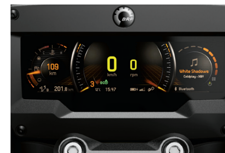
INDICATEUR NUMÉRIQUE Grand écran LCD panoramique couleur 7,8" sur la série spéciale.