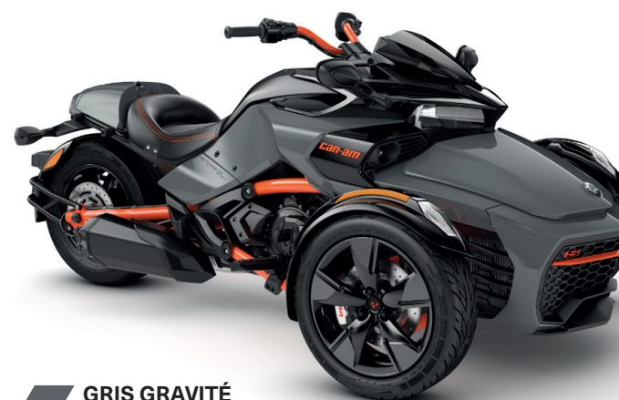
GRIS GRAVITÉ SÉRIE SPÉCIALE