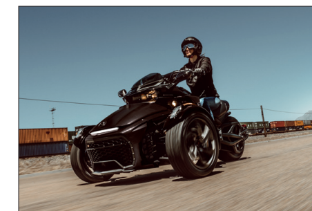
VSS Système de stabilité du véhicule qui fait appel à diverses technologies, dont SCS / ABS / TCS, pour surveiller le véhicule et procurer au conducteur la confiance nécessaire sur la route.