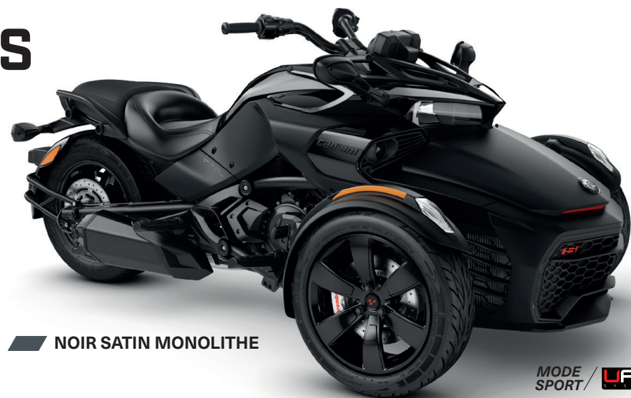
NOIR SATIN MONOLITHE