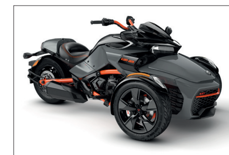
SÉRIE SPÉCIALE Ensemble spécial destiné aux passionnés, fourni pré-équipé de plusieurs accessoires.