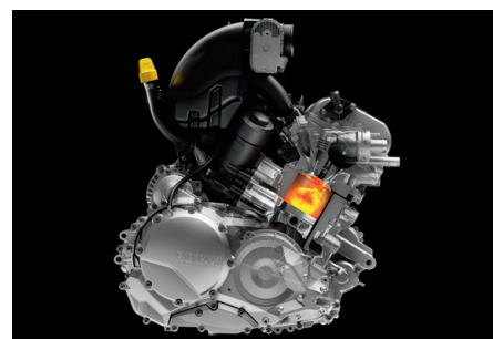
MOTEUR ROTAX 1330 ACE Moteur de 115 chevaux. Cette puissance accrue ne peut signifier qu'une chose : de meilleures performances. Notre moteur le plus puissant vous permet de braver la route en sachant que vous disposez de la puissance que vous souhaitez au moment où vous en avez besoin.