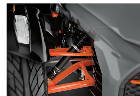
AMORTISSEURS FOX† Les amortisseurs avant à gaz calibrés pour le sport apportent réactivité, sensations sportives et performances exceptionnelles sur les routes les plus exigeantes.