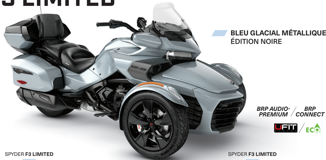
SPYDER F3 LIMITED