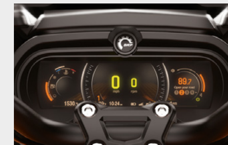
TABLEAU DE BORD NUMÉRIQUE : Grand écran couleur LCD panoramique 7,8 po associé à la technologie BRP Connect™ qui permet d'intégrer des applications pour smartphone optimisées pour les véhicules (applications multimédias, de navigation et bien plus encore) et d'y accéder depuis des boutons situés sur le guidon.

SYSTÈME UFIT : Se règle en un rien de temps en fonction de la taille et du style de conduite du pilote.