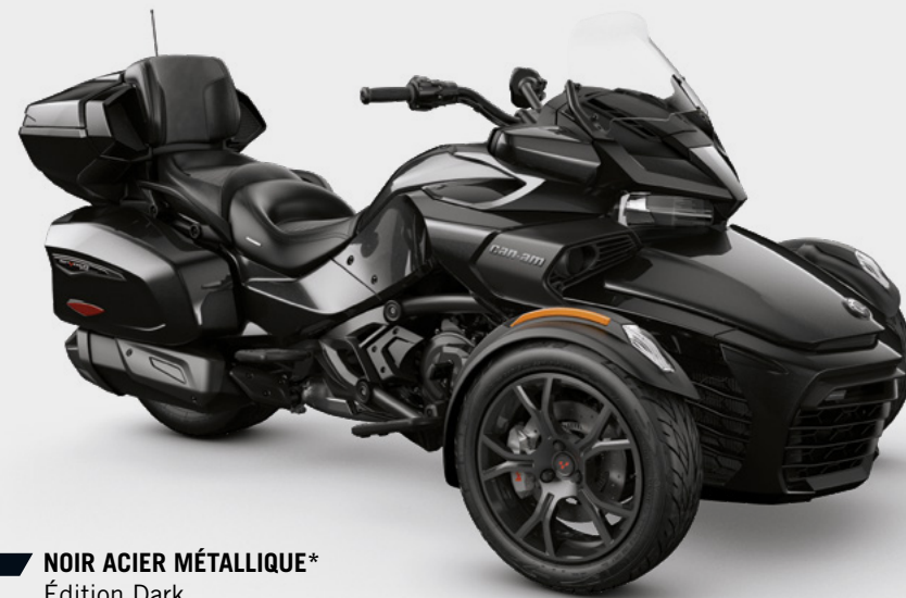
NOIR ACIER MÉTALLIQUE* Édition Dark

*Éléments et garnitures disponibles en éditions Chrome ou Dark