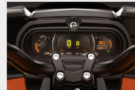
TABLEAU DE BORD NUMÉRIQUE : Grand écran couleur LCD panoramique 7,8 po associé à la technologie BRP Connect™ qui permet d'intégrer des applications pour smartphone optimisées pour les véhicules (applications multimédias, de navigation et bien plus encore) et d'y accéder depuis des boutons situés sur le guidon.

SYSTÈME UFIT : Se règle en un rien de temps en fonction de la taille et du style de conduite du pilote.